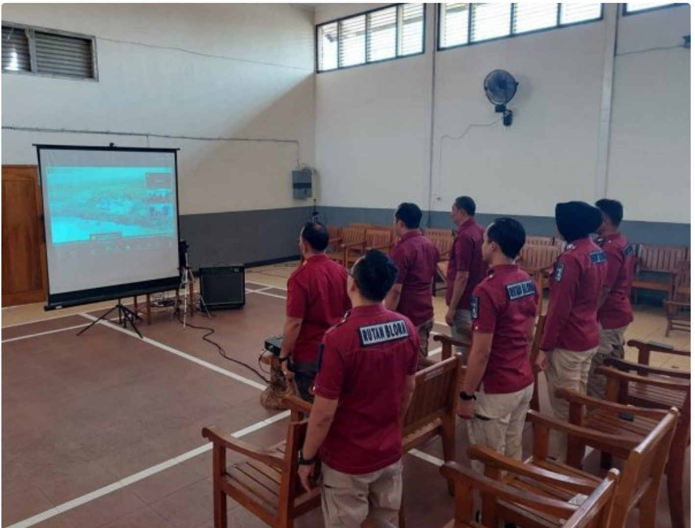
Rutan Blora Ikuti Webinar Series 5 Bersama BPSDM Hukum dan HAM

Blora – Rumah Tahanan Negara (Rutan) Kelas IIB Blora Kantor Wilayah Kementerian Hukum dan Hak Asasi Manusia (Kemenkumham) Jawa Tengah mengikuti Webinar Series 5 bertema “Powerful Coaching, Mentoring, dan